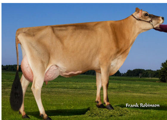
JX SCHULTZ VANDRELL DEXXIE {3} FOURTH DAM